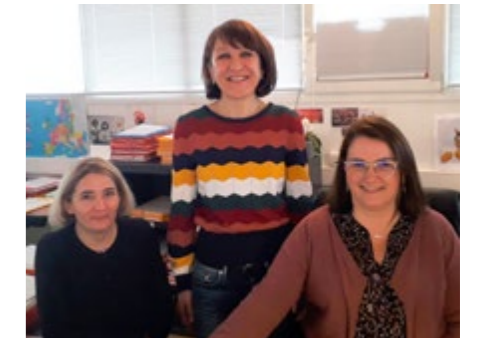
Service urbanisme de la communauté de communes des Hauts Tolosans

L'accueil physique sera organisé exclusivement sur rendez-vous.